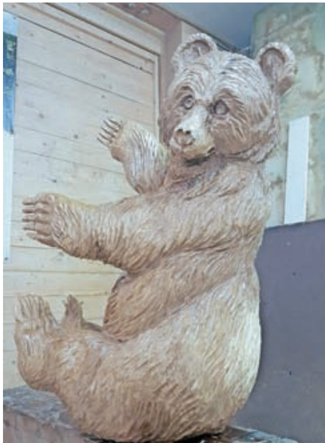
Medved, ki je nastal pod rokami cerkljanskega rezbarja