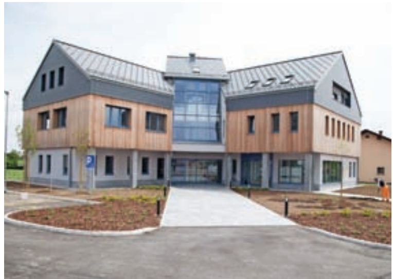
Urejajo tudi okolico novega zdravstvenega doma, ki bo odprt 15. junija.