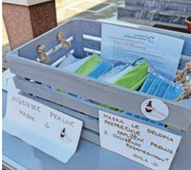
Več sto zaščitnih mask so podarili v Copku.

Kako je zrasla ideja o širjenju mask? »Z nekaterimi stanovskimi kolegicami širom Slovenije smo se dogovorile za to dejanje, seveda vsaka v svojem domačem kraju. Nekaj