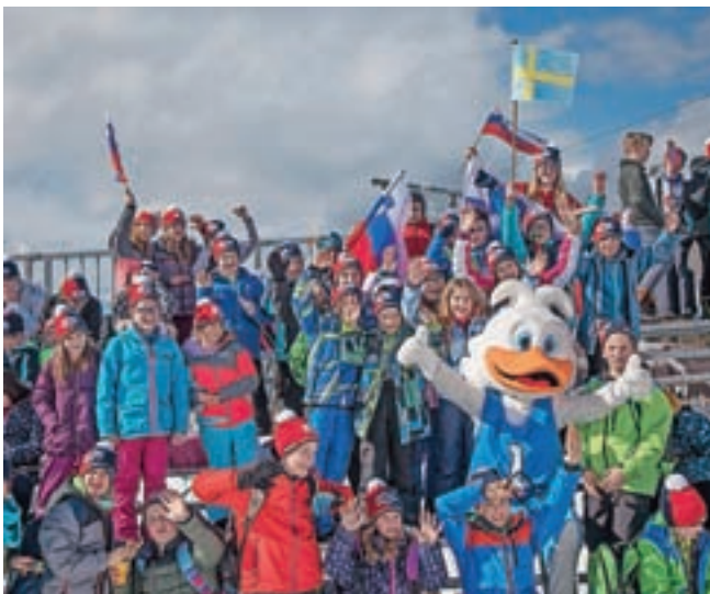
Zbralo se je tudi precej navijačev.