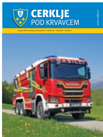
Na naslovnici: Cerkljanski gasilci so bogatejši za novo vozilo s cisterno.