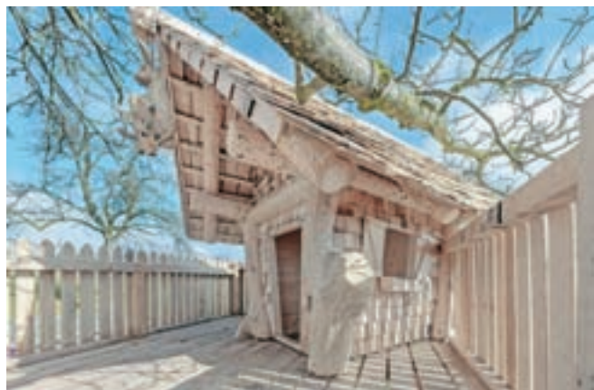
Ena od stvaritev Matica Zakrajška

Danes je le še nekaj mojstrov, ki znajo delati skodle, zato je to obrt, ki se počasi izgublja, in prav lahko se zgodi, da