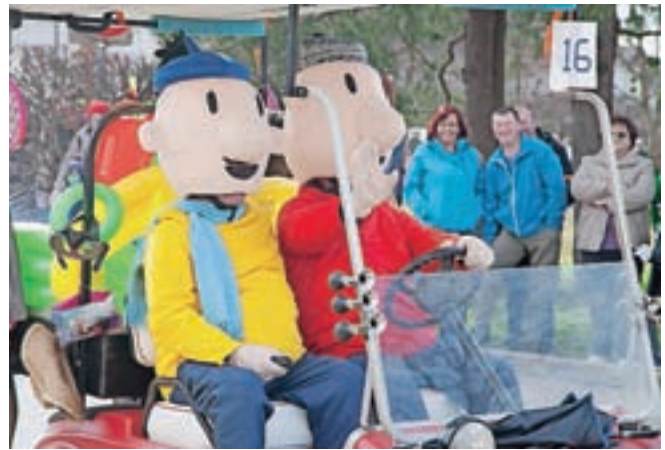
Znamenita junaka risanke A je to!

Eden zadnjih dogodkov, ki smo jim bili priča v Cerkljah pred razglasitvijo epidemije covid-19, je bila pustna povorka, ki je skozi središče Cerkelj potekala v soboto, 22. februarja. Organizatorji, Društvo Godlarjev iz Šenčurja, je tudi tokrat poskrbelo za vse generacije. Niso manjkale maske, ki odslikavajo aktualno družbeno-politično dogajanje v Sloveniji, ki so se jim nasmejali predvsem odrasli in po katerih Godlarji slovijo daleč naokoli, skozi Cerklje pa so se sprehodili tudi klovni in risani junaki, ki so očarali predvsem najmlajše. Vseh skupaj pa ravnodušnih niso pustili niti znameniti ptujski kurenti, ki so se prav tako udeležili povorke. Številni obiskovalci, ki