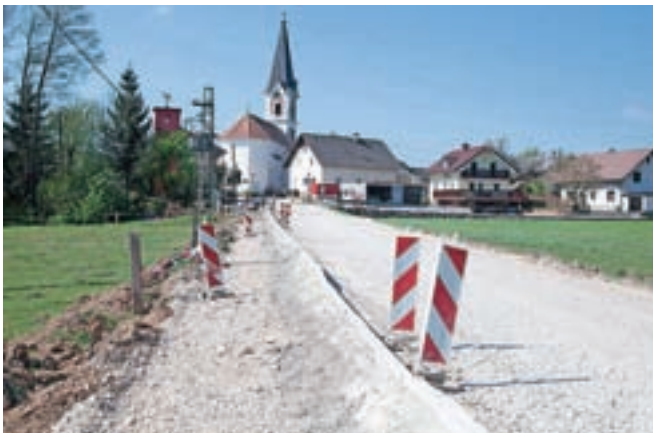
Investicija v Zalogu zajema tudi gradnjo pločnikov.

Vodno infrastrukturo obnavljajo tudi med Šmartnim in Glinjami. Med drugim bodo obnovili in razširili tudi most v Šmartnem. Celotna investicija bo znašala dvesto tisoč evrov.