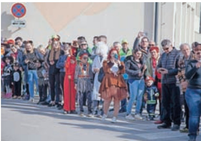
Precej pustnih šem je bilo tudi med gledalci.