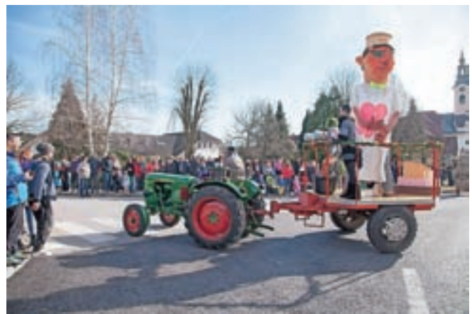
Pustno povorko so pripravili šenčurški Godlarji.