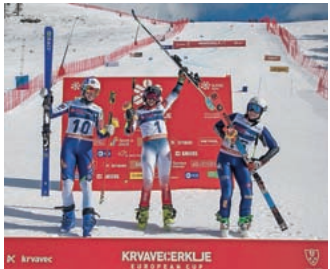
Najboljše tri