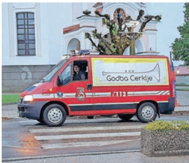
Prvomajska budnica na »korona način«

Godba Cerklje letos praznuje desetletnico delovanja. Pandemija je naše načrte v zvezi s proslavitvijo okrogle oble-