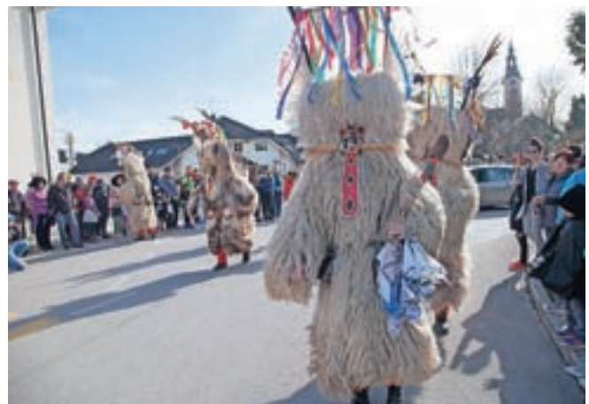
Kurenti nikogar ne pustijo ravnodušnega.