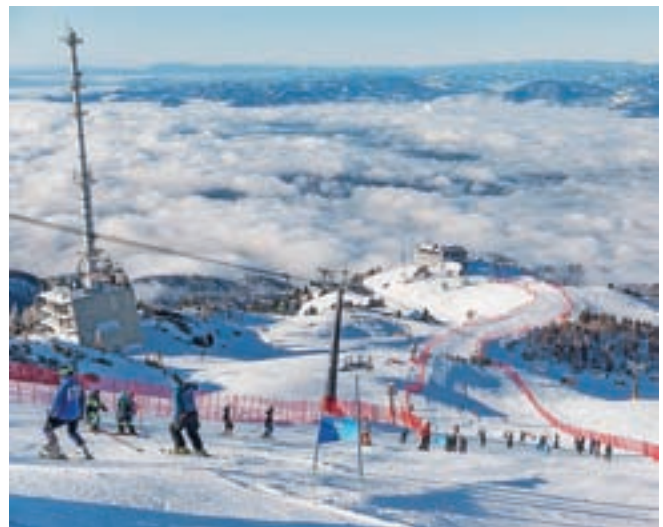
Čudovita kulisa na Krvavcu