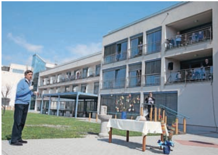
Obisk predsednika republike Boruta Pahorja v Domu Taber

V petek, 24. aprila, pa so zaposleni v več kot sedemdesetih domovih za starejše po Sloveniji za 15 minut zapustili prostore domov in na dvoriščih opozorili odločevalce, » ... da imamo dovolj njihove samovolje, neustreznih, nestrokovnih in nedoslednih navodil ter systemske diskriminacije naših stanovalcev«. Protestu so se pridru-