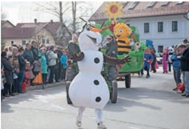
Manjkali niso niti risani junaki.