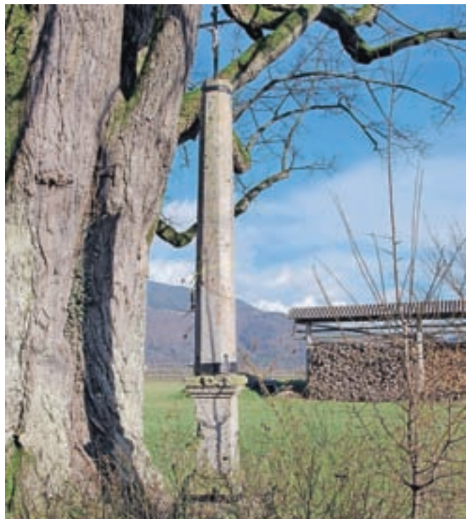
Kužno znamenje ob lipi, ki naj bi bila posajena ob istem času

Kamnito kužno stebrno znamenje izvira iz druge četrtine 17. stoletja, iz leta 1645. Enake starosti naj bi bila tudi lipa, ob kateri stoji znamenje. Stoji na široki kamniti stopnici kvadratnega prereza s kapitelom. Steber se zožuje proti vrhu s kovinskim razpelom na zaključku. Na južni strani je dobro vidna letnica 1645, nad njo je osmerokotni obelisk, ki spominja na gotsko tradicijo, z novejšim križem na vrhu. Nahaja se na vzhodnem robu Cerkelj ob ozki poljski poti, v bližini župnijske cerkve Marije Vnebovzete. Čeprav je oblika kužnega znamenja nenavadna, nas letnica 1645 prepriča, da gre zares za kamniti spomin na bolezen, ki je tega leta morila tod okoli. V vaseh Spodnji Brnik in Vopovlje so tistega leta imeli vsak dan do pet ljudi, ki so umrli za kugo. Zato so jih začeli pokopavati na novo pokopališče na Spodnjem Brniku, ob podružnični cerkvi sv. Simona in Juda Tadeja. Nekdaj je vodila mimo znamenja prometna cesta proti Pšenični Polici, Zalogu in naprej proti Kamniku. Odkar so cesto prestavili, znamenje sameva.