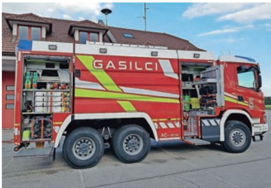
Novo vozilo je naložba v požarno varnost za prihodnjih nekaj desetletij

Novo gasilsko vozilo, ki je v prvi vrsti namenjeno zagotavljanju zadostne količine vode na požarišču, je zgrajeno na podvozju Scania G 460, s stalnim 6x6 pogonom in avtomatiziranim menjalnikom. V kabini je prostor za voznika in dva člana posadke. V nadgradnji je med boksa za opremo vgrajen