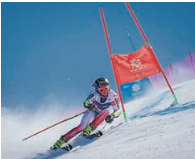
Tekmovalke so se pomerile na odlično pripravljene progi.

Glavni partner in podpornik dogodka, ki so ga pod okriljem Smučarske zveze Slovenije organizirali člani ASK Triglav Kranj, je bila Občina Cerklje, ki je projekt tudi finančno podprla.