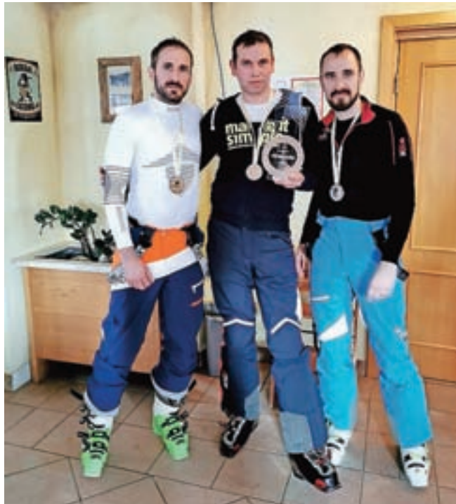
Med vaškimi skupnostmi je zmagala ekipa Poženika.